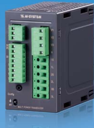
L53U DIN 轨道安装式